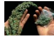
Türkiye'de 19 ilde kenevir yasallaştı