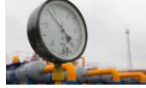
İran'dan Türkiye açıklaması: Doğalgaz miktarını arttırmak