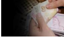
Emeklilere kötü haber... Bakan açıkladı

YAZARLAR SİYASET TÜRKİYE DÜNYA EKONOMİ KÜLTÜR-SANAT ÇİZERLER SPOR YAŞAM TEKNOLOJİ SAĞLIK EĞİTİM FOTOĞRAF VIDEO SOKAK GEZİ