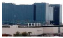
AVM şirketine kayyım atandı