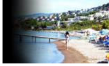
Bodrum'da otelciler gelecek sezon için de karamsar