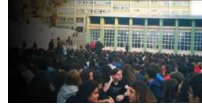
İkna odaları geri döndü