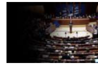
'Darbeyi anladık demokrasiye dön'