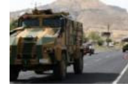
Van ve Hakkari'de art arda saldırılar: Çok...