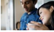
İstanbul'un en çapkın ilçeleri belirlendi!