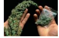
Türkiye'de 19 ilde kenevir yasallaştı