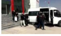
Van'da ev baskını: Üç kişi tutuklandı