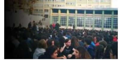
İkna odaları geri döndü