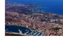
İzmir'de SİT haritası yenilendi... Belediye Başkanı'ndan tepki