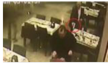
"Hesabı ben ödeyeceğim" cinayetinde müebbet