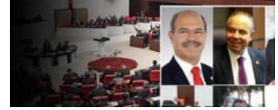
Skandal önerge Meclis'te: Cinsel istismara uğrayan mağdur tecavüzcüsüyle evlendirilsin