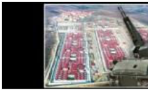
Silivri, Sincan ve Şakran'a uçaksavar