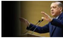
Ekonomist: Erdoğan kaosun nedenlerinden biri