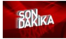
Putin'den Suriye açıklaması: Erdoğan'la anlaştık