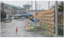
Cumhurbaşkanları tarafından kullanılan Devlet Konuğu'nun