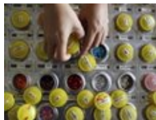
السعودية: فرض اختبار «الإيدز» على خمس حالات فقط