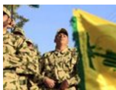
عقوبات أميركية على «حزب الله» تستهدف 6 أفراد و7 شركات