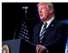
واشنطن لا تستبعد شن ضربات عسكرية في سورية