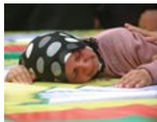
واشنطن تدرس خياراتها في سورية وموسكو تتهمها بـ «تفخيخ» التسوية