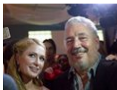
انتحار نجل الزعيم الكوبي فيدل كاسترو