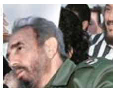
كاسترو الابن انتحر بعد صراع مع اكتئاب