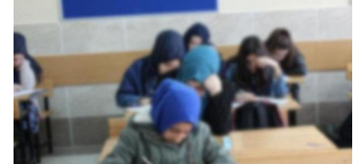
MEB'den karma eğitime darbe