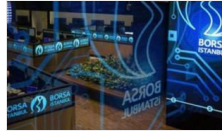
Borsa günü düşüşle tamamladı