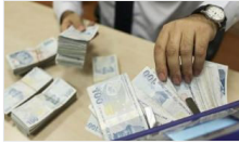
Adım adım yavaşlama