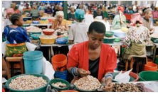
Tanzanya'da kaju fıstığı krizinde ordu devreye girdi