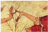
قصر فيتيليتشي يحتضو للحضارة الاثروسكية