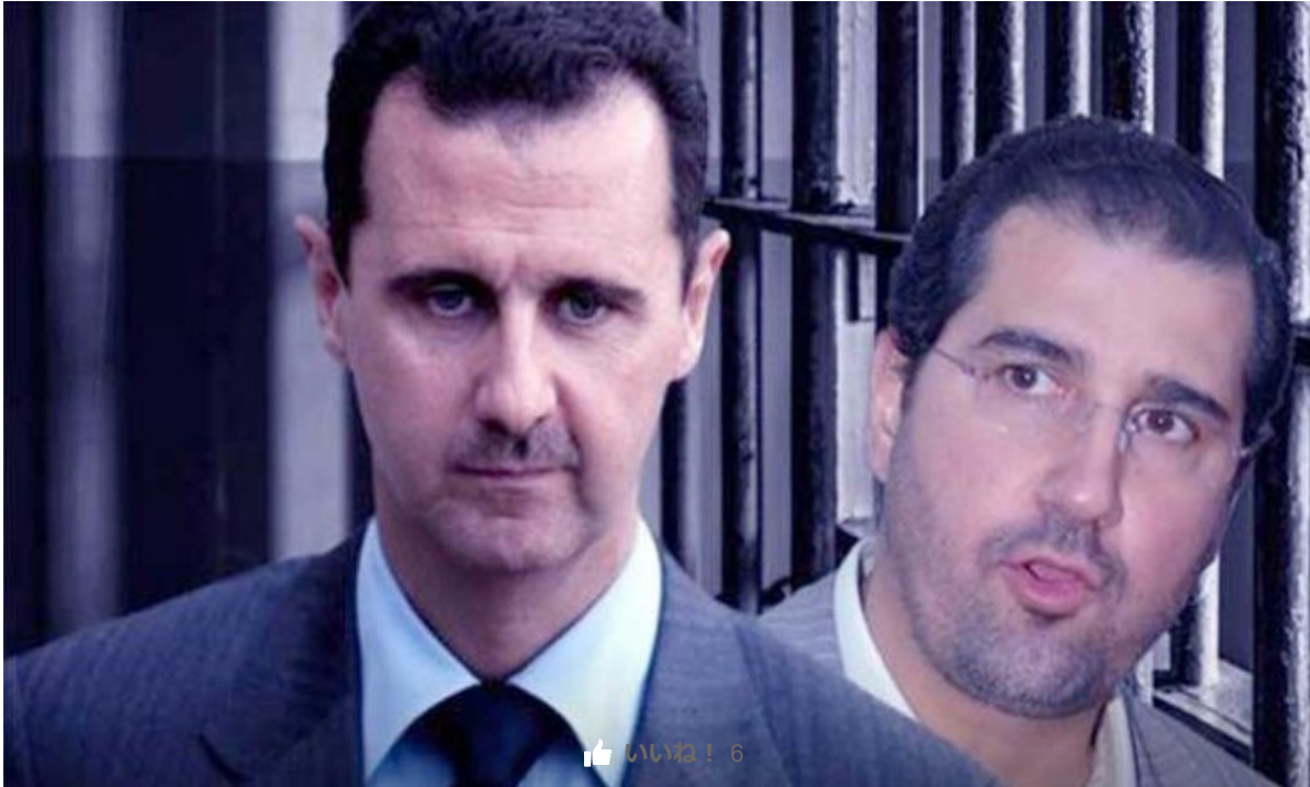
بشار الأسد - رامي مخلوف

دمشق - "القدس العربي": هددت الهيئة الناظمة للاتصالات في سوريا شركة سيريتل التي يرأس رامي مخلوف مجلس إدارتها باتخاذ الإجراءات القانونية بحقها بعد انقضاء المهلة الممنوحة لها لتسديد المبلغ المطلوب منها والبالغ حوالي 130 مليار ليرة وقالت الهيئة إنها تحمل شركة سيريتل كل التبعات القانونية والتشغيلية نتيجة قرارها الرفض لإعادة حقوق الدولة المستحقة عليها. وقالت الهيئة في بيان لها إنه وبعد رفض شركة سيريتل دفع المبالغ القانونية المستحقة عليها فإنها ستقوم باتخاذ التدابير القانونية لتحصيل هذه الحقوق واسترداد الأموال بالطرق القانونية المشروعة المتاحة.