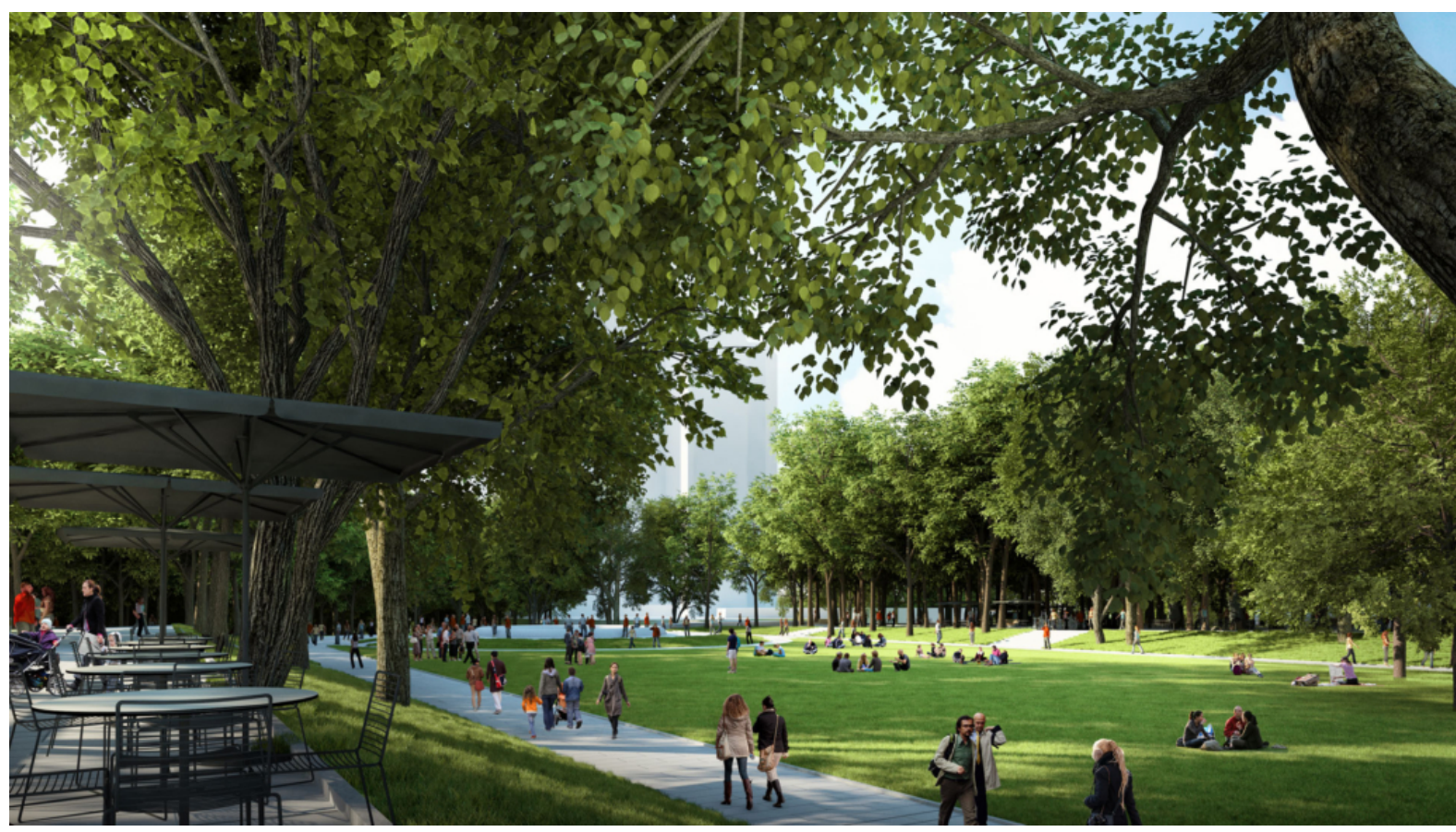
16 Sıra Numaralı Proje - Herkesin ve her şeyin meydanı Taksim

Bugün başlayan süreçte, İstanbul halkı, T.C. numaraları ile 19 Ekim-12 Kasım 2020 tarihleri arasında istanbulsenin.org üzerinden oylarını kullanabilir.