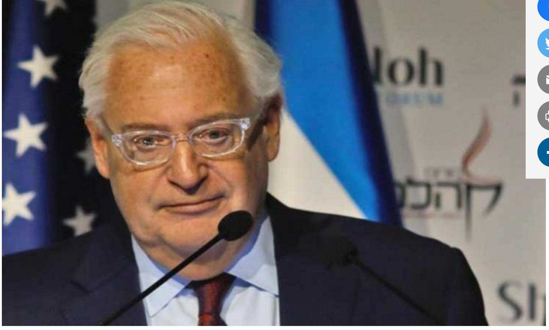
السفير الأمريكي في إسرائيل ديفيد فريدمان