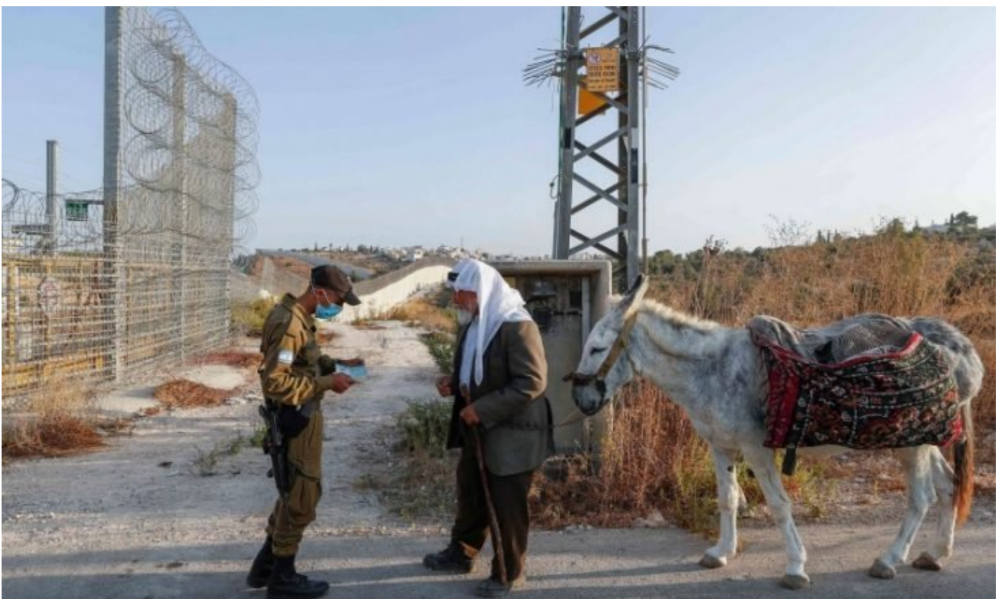
جندي من جيش الاحتلال يدقق في أوراق فلسطيني يحاول الوصول إلى أرضه خلف الجدار الفاصل