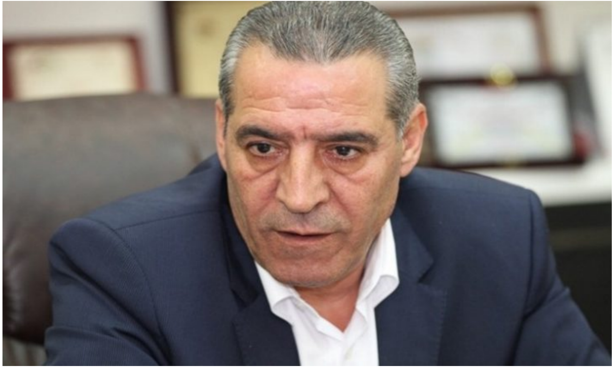
وزير الشؤون الدنية الفلسطينية حسين الشيخ