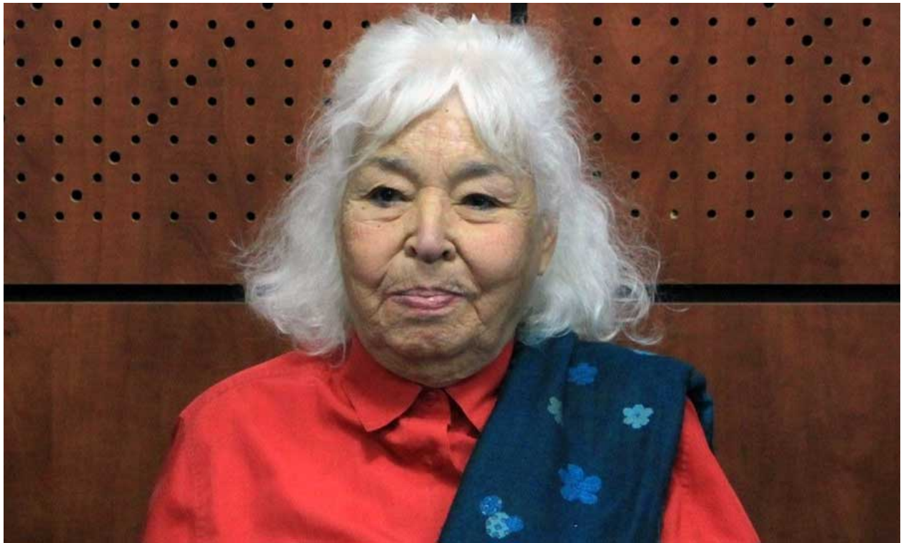
السعداوي عند تلقيها الوسام الوطني للاستحقاق الثقافي في تونس

يصف أحد القراء موقف السعداوي بأنه هروب من المواجهة والنضال من الخارج، فكان ردها.. كلمة «الهروب» لا تنطبق عليّ ولا أحبها، وهناك أناس يصطادون في المياة العكرة. فأنا مندمجة في المجتمع المصري حتى النخاع، أكثر من الحكومة المصرية ذاتها. فكتبي قرأتها أربعة أجيال منذ نشرها حتى الآن. عندما خرجت من مصر كنت غاضبة من النخبة المصرية والعربية، التي باعت نفسها لرجال المال والسلطة، الذين يحكمون البلاد. ليس غريبا أن تصمت تلك النخبة عندما تم تقديمي للمحاكمة بتهمة التكفير.