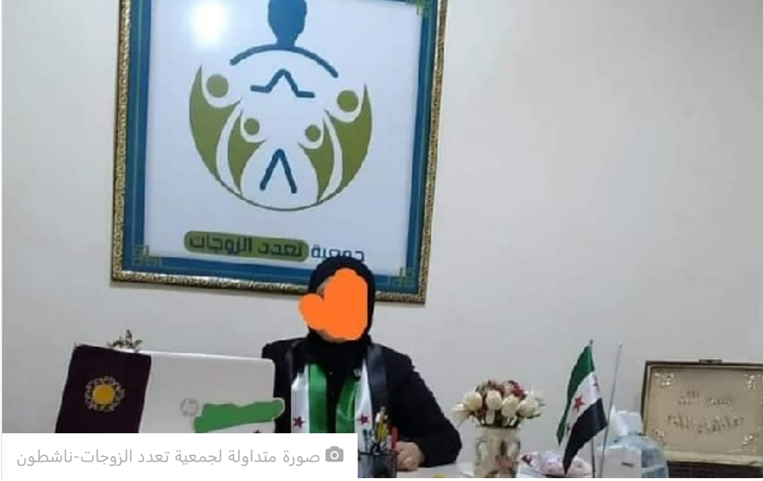
صورة متداولة لجمعية تعدد الزوجات-ناشطون