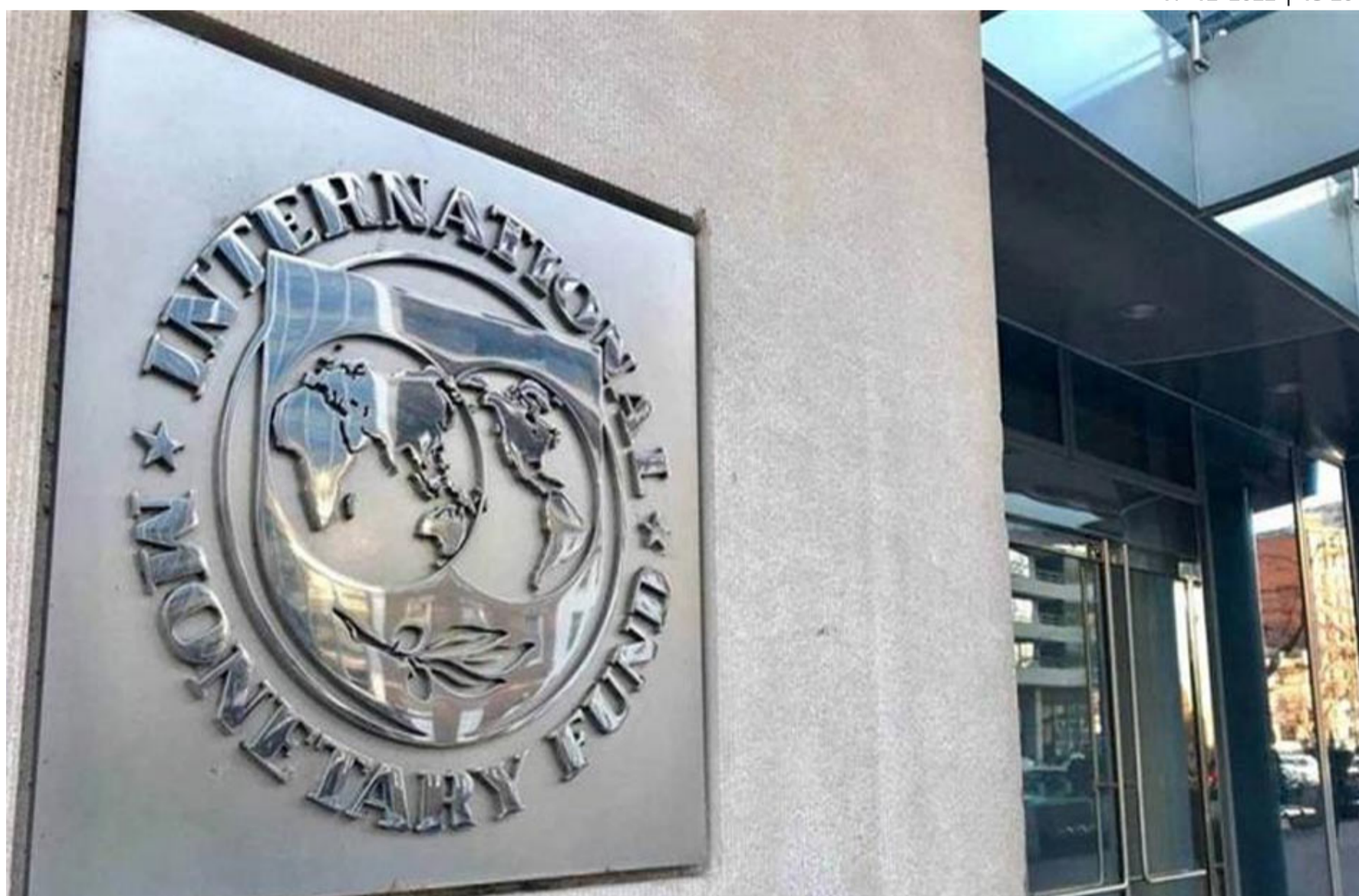
صندوق النقد الدولي