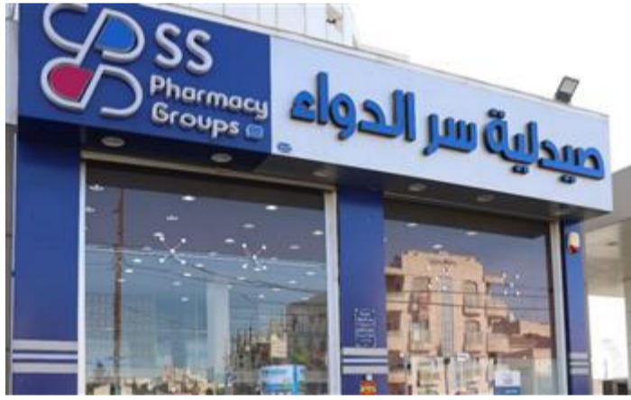
صيدليات سر الدواء: السوق المصرية من الأسواق الحيوية في الصيدلة والطب