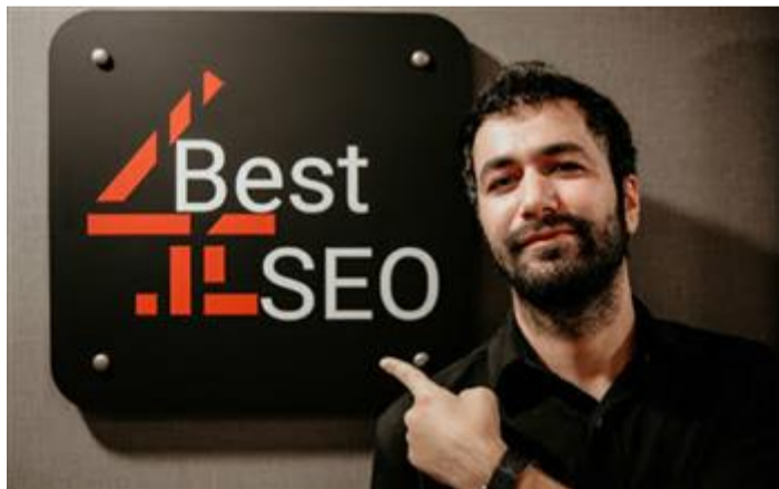
دليل شامل للسيو بالعربي: استعانة بشركة سيو لتحقيق نجاح موقعك