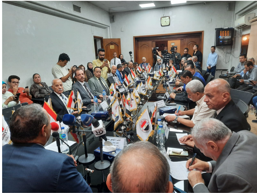
تحالف الأحزاب المصرية - أرشيفية