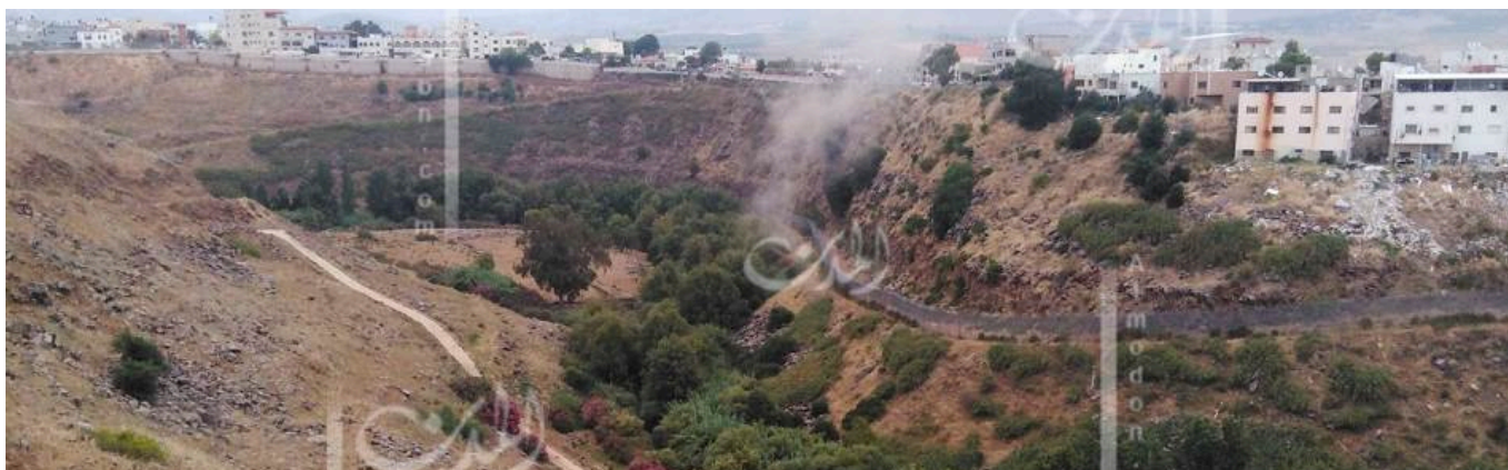
منطقة الوزاني تعرضت لغارة إسرائيلية في وقت سابق