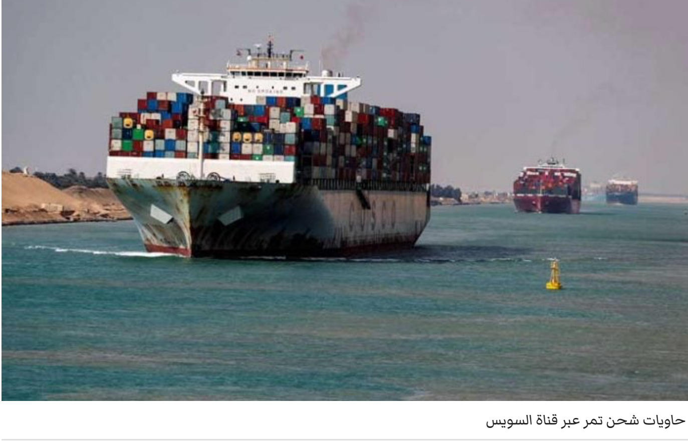
حاويات شحن تمر عبر قناة السويس