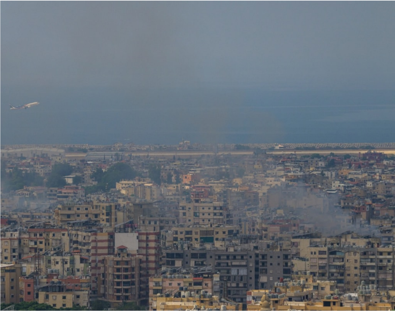
جانب من القصف الذي يستهدف الضاحية الجنوبية لبيروت. -A +A

حذر مجلس نقابة الكيمايين المواطنين من "الاقتراب من المناطق التي تتعرض للقصف الإسرائيلي بقطر يتجاوز الكيلومترين". وتمنى على "المرغمين من الاقتراب لهذه المناطق الالتزام باللباس الواقي للغبار ولوضع الكمامات المختصة للمواد الكيمايية".