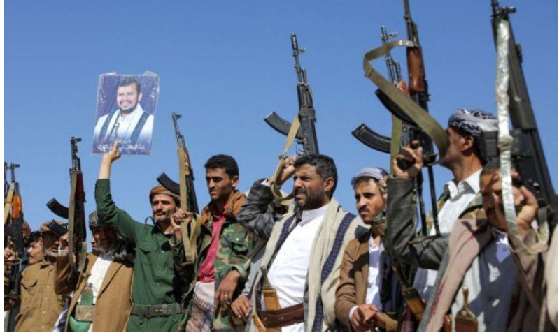
الحوثيون يعلنون 7 أكتوبر إجازة رسمية.. وزعيم «أنصار الله» يؤكد الوقوف إلى جانب المقاومة الفلسطينية