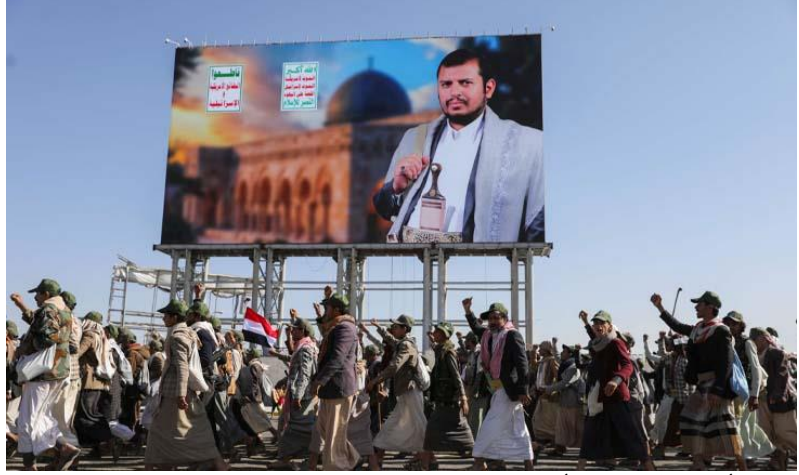
زعيم «أنصار الله» يجدد التأكيد على الوقوف إلى جانب المقاومة الفلسطينية