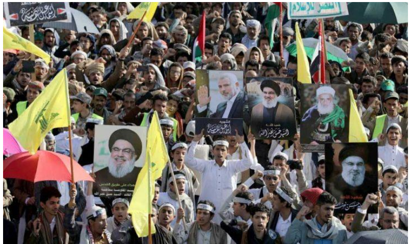
عشرات المظاهرات في اليمن إحياء لذكرى «طوفان الأقصى»... وعلماء الدين: الحيأ في هذه المعركة حرام