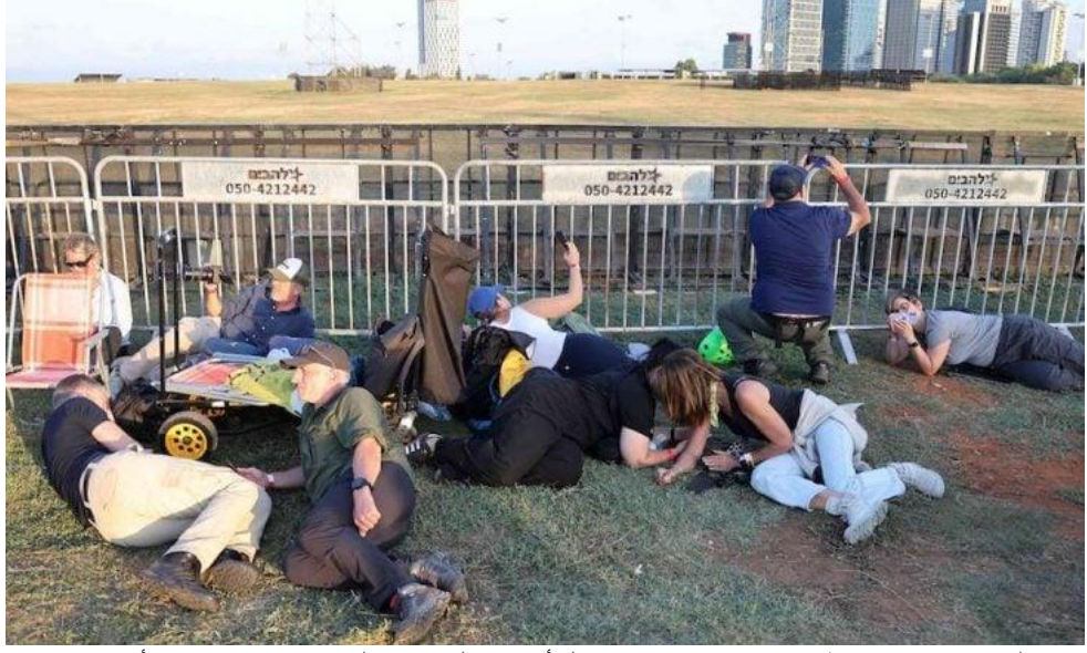
إسرائيليون يحتمون مع انطلاق صفارات الإنذار في تل أبيب خلال الإعداد لمراسم إحياء ذكرى 7 أكتوبر