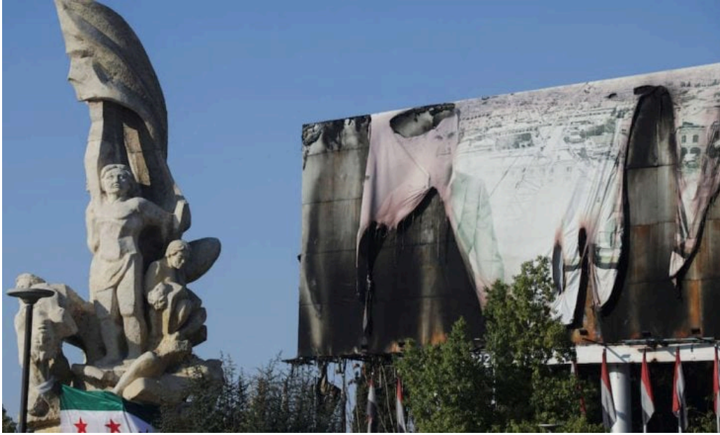
صورة محترقة لرئيس النظام السوري بشار الأسد في حلب

“القدس العربي”: قالت إدارة غرفة عمليات المشتركة لفصائل المعارضة إن قواتها “تتقدم بشكل كبير على مختلف المحاور في أرياف حماة وحلب، وسط حالة انهيار كبير في صفوف العدو، وانسحاب سريع له من عشرات المواقع الهامة، تزامن ذلك مع انشقاق عشرات العناصر”.