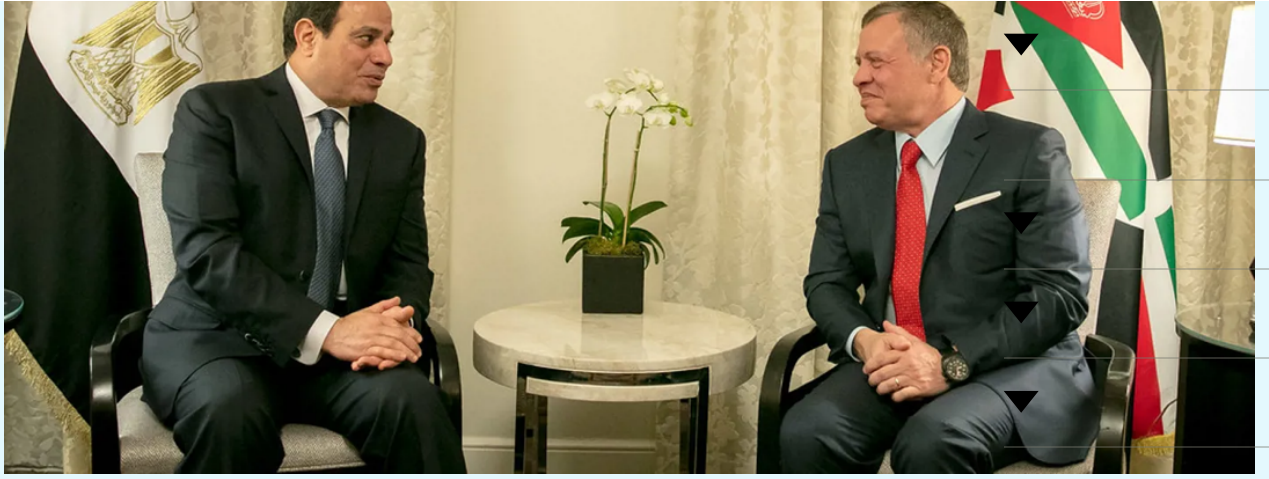
الرئيس السيسي والملك عبدالله الثاني.