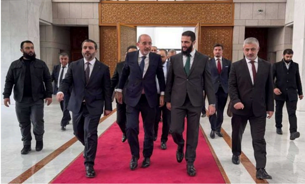
أحمد الشرع يستقبل وزير الخارجية الأردني في دمشق