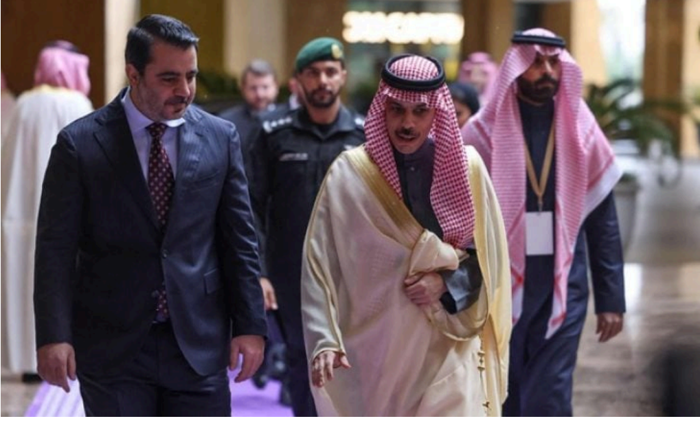
وزير الخارجية السعودي فيصل بن فرحان ونظيره السوري أسعد الشيباني قبل اجتماع الرياض في 12 يناير 2025.

الرياض: طالب اجتماع الرياض بشأن سوريا، الأحد، برفع العقوبات المفروضة على دمشق، وتهيئة ظروف عودة اللاجئين السوريين إلى بلادهم.