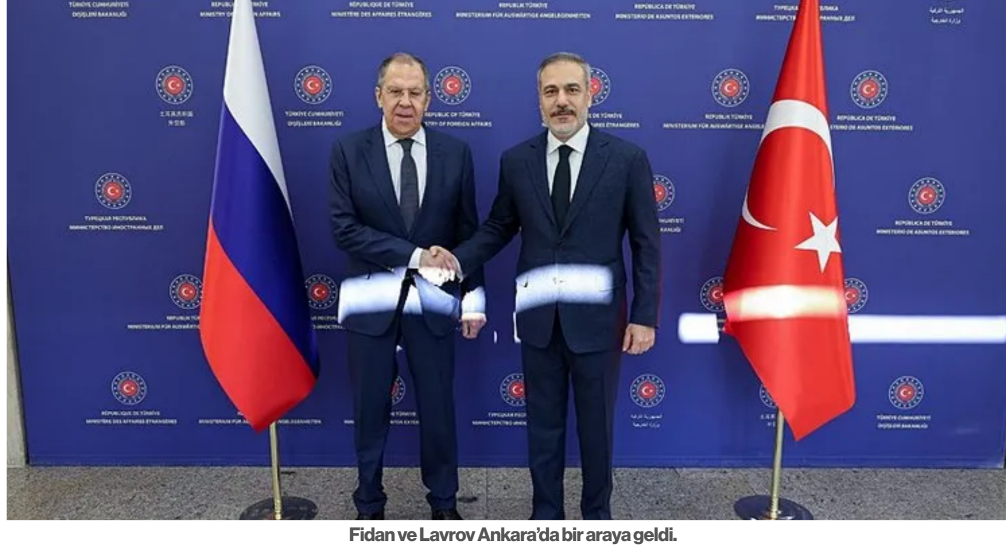
Fidan ve Lavrov Ankara’da bir araya geldi.

Dışişleri Bakanı Hakan Fidan ve Rus mevkidaşı Sergey Lavrov, Ankara’da bir araya geldi. Ukrayna için çözümleri görüşen iki bakan, Suriye’deki ayrılıkçı hareketlerin önlenmesi konusunda hemfikir olduklarını vurguladı. Öte yandan Cumhurbaşkanı Erdoğan bir video mesaj ile Ukrayna’nın bağımsızlığını desteklediklerini açıkladı.