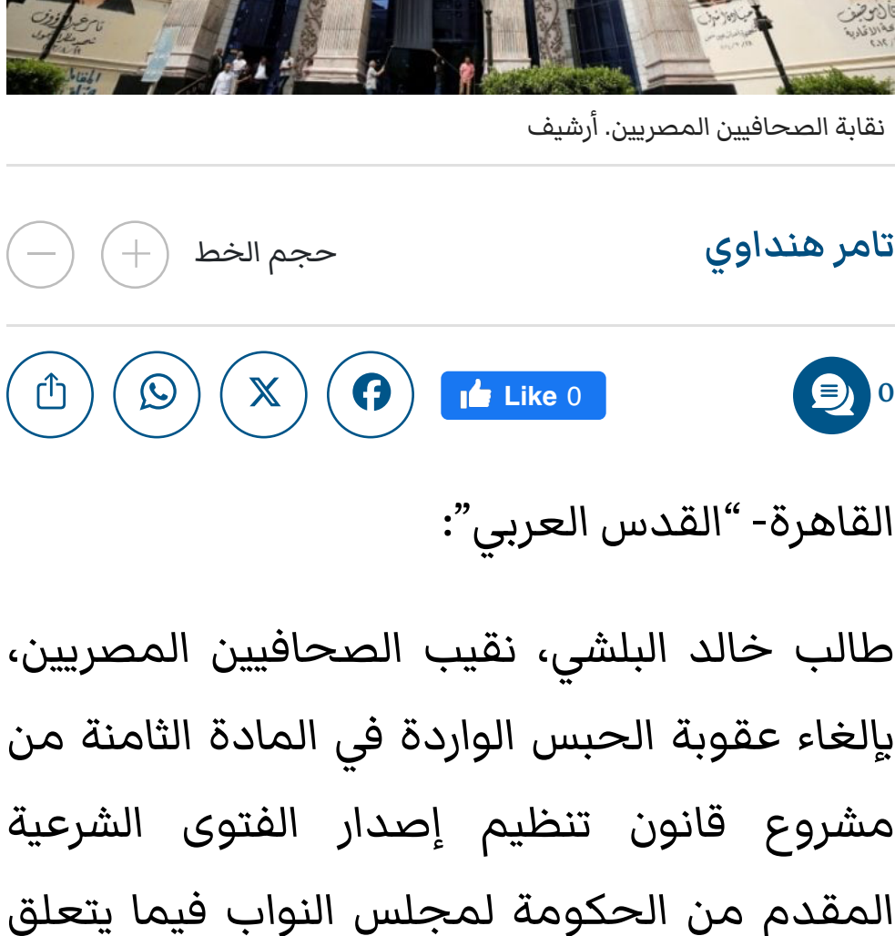
نقابة الصحفيين المصريين. أرشيف