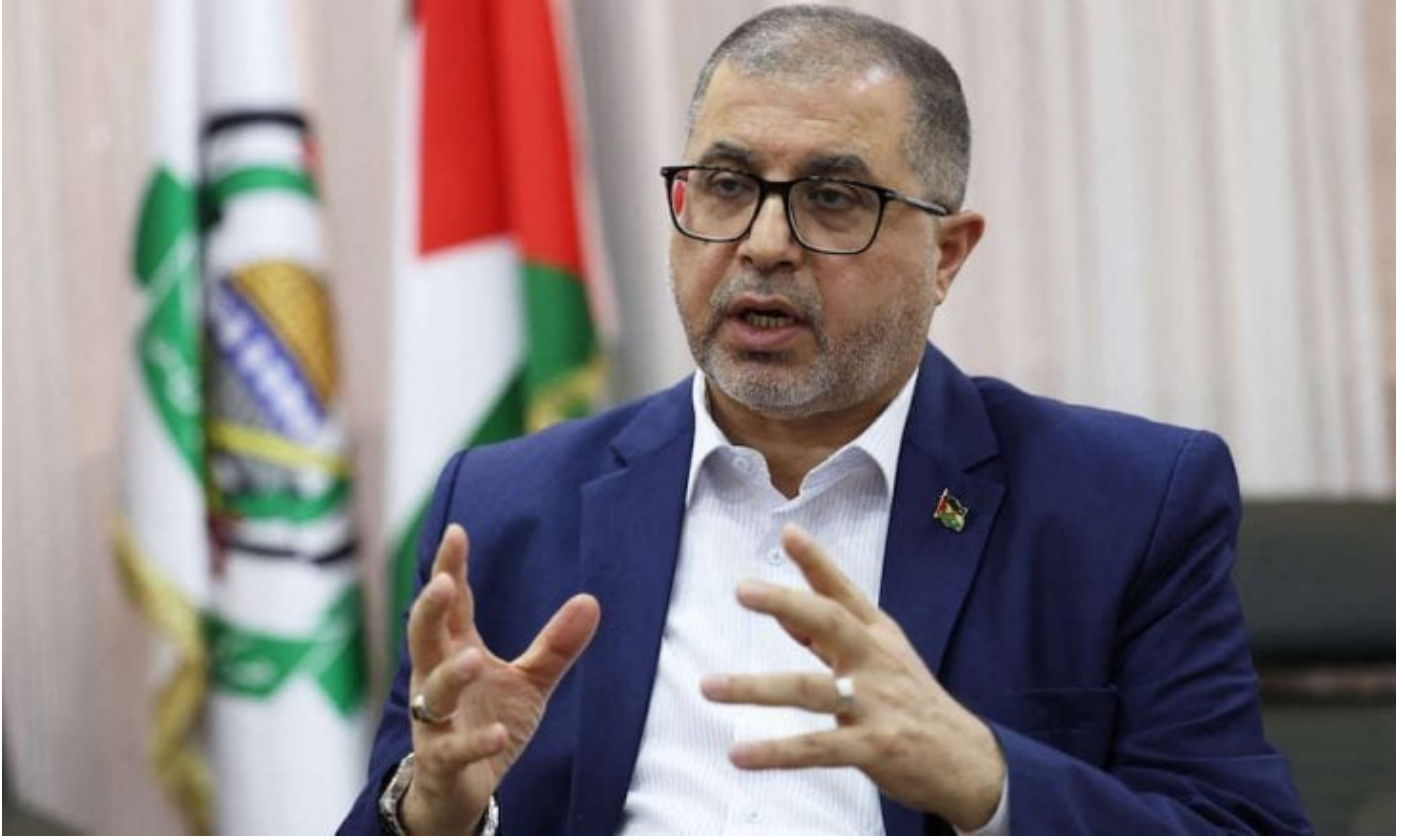
عضو المكتب السياسي في حماس باسم نعيم

غزة: أكد باسم نعيم العضو البارز في حركة حماس أن الحركة بصدد إجراء محادثات مباشرة مع الولايات المتحدة.