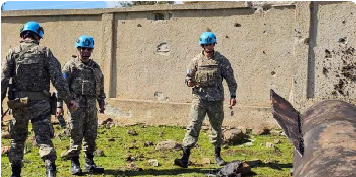
جنود من الـ"أندوف" في القنيطرة السورية

القنيطرة - نور الحسن | الجمعة 2026/03/27