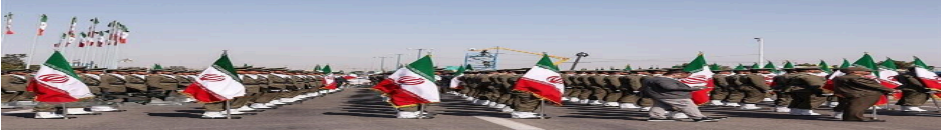
الحرس الثوري الإيراني: أصينا مقاتلة أمريكية من طراز إف 16 في أجواء محافظة فارس