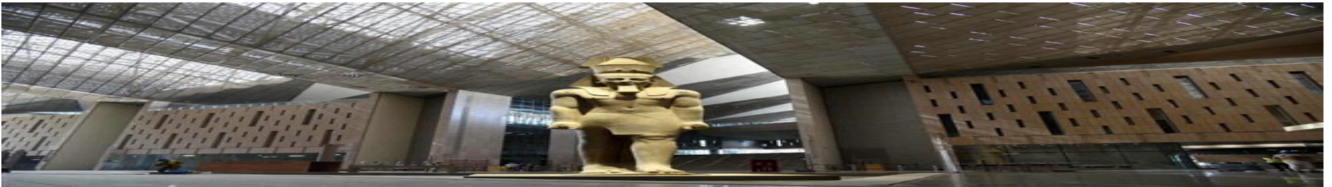
مجلة «Time» تختار المتحف المصري الكبير ضمن أفضل المعالم السياحية والأثرية للزيارة خلال عام 2026