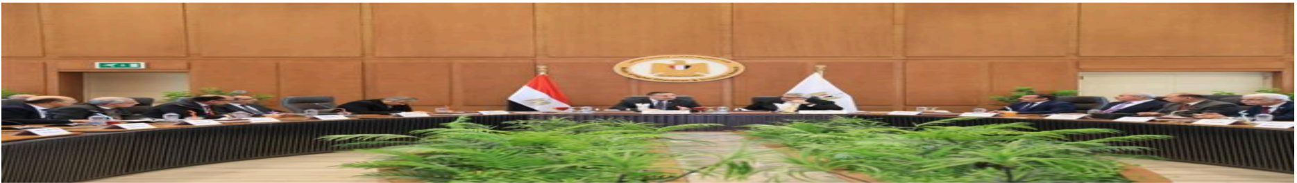
الأعلى للجامعات يُقر الخريطة الزمنية للعام الدراسي الجديد 2026/2027