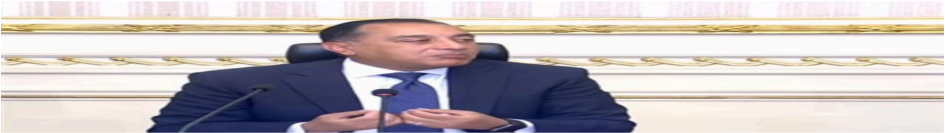
رئيس الوزراء: الحكومة تتبع سياسة التدرج في اتخاذ القرارات لضمان عدم تحميل المواطن أعباءً إضافية