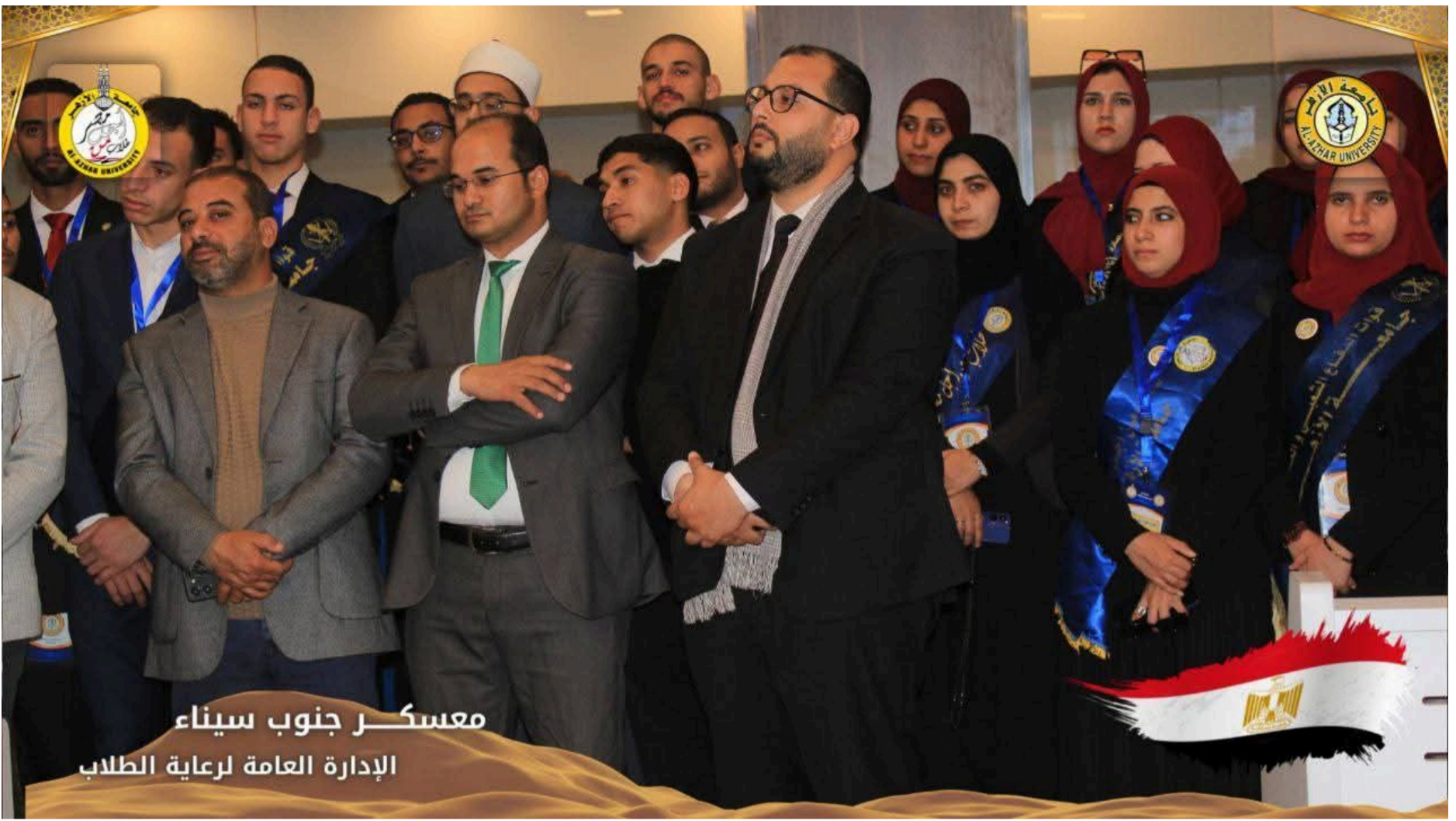
جامعة الأزهر تنظم زيارة ميدانية لطلاب من أجل مصر إلى أرض سيناء