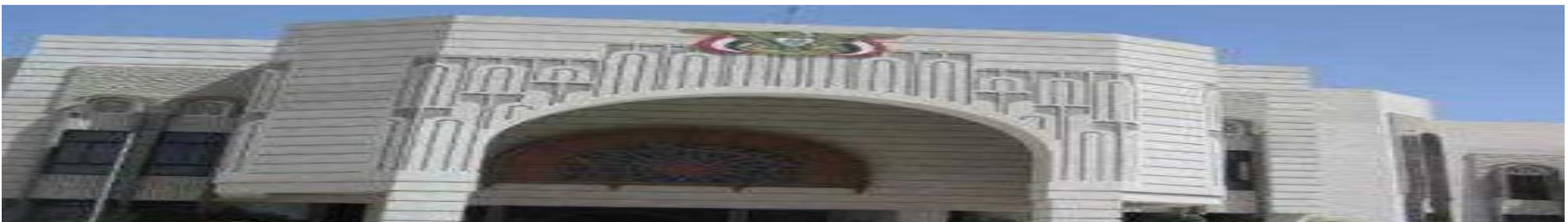
الحكومة اليمنية: انحراط الحوثيين بالدفاع عن النظام الإيراني يعرض أمننا القومي للخطر