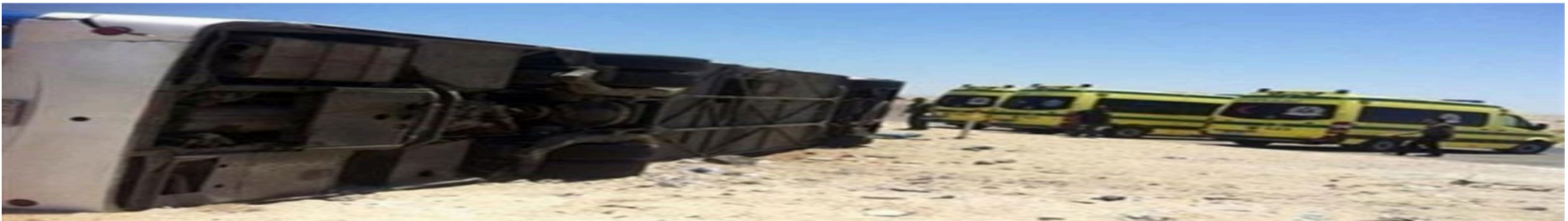
إصابة 12 مواطنًا في انقلاب أتوبيس على الطريق الصحراوي بالبحيرة