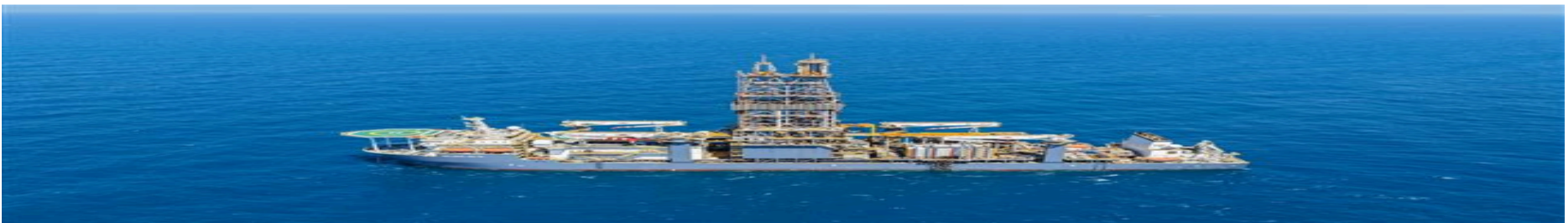
البتروك: بئر فيوم 4 يدخل الإنتاج في يوليو بـ 100 مليون قدم مكعب غاز يوميًا