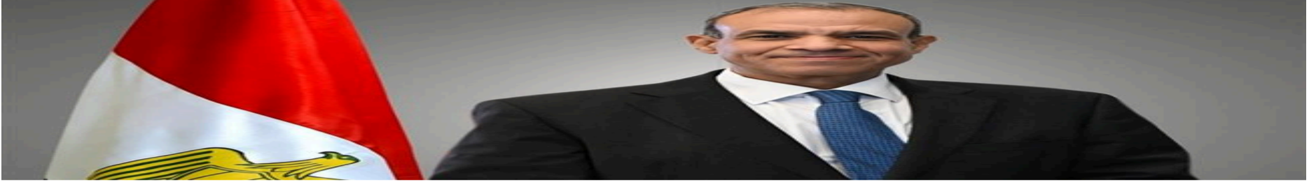
وزير الخارجية يلتقي نظيره القطري بالدوحة لتنسيق جهود الوساطة وخفض التصعيد