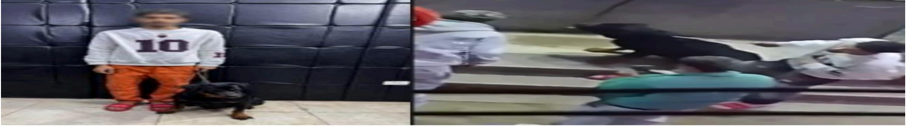
كلب للترهيب لا للمزاج.. سقوط صاحب فيديو «ترويع شاب» في مدينة نصر