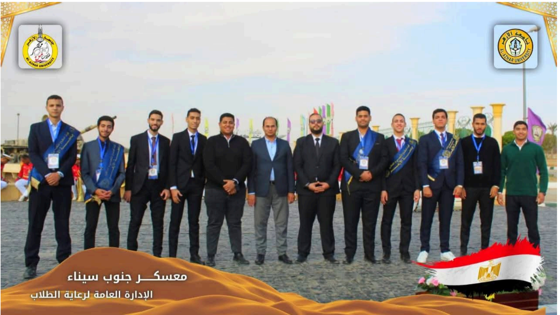
جامعة الأزهر تنظم زيارة ميدانية لطلاب من أجل مصر إلى أرض سيناء