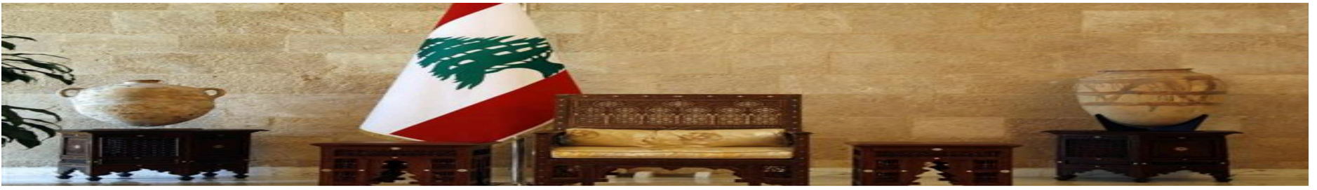
قوى سياسية لبنانية ستتحرك لإنشاء محكمة خاصة لمحاسبة كل من ورط البلاد في الحرب