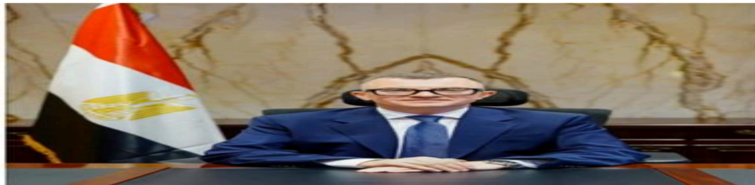
وزير التخطيط: 3.8 تريليون جنيه استثمارات بخطة 2026/2027.. وبناء الإنسان في صدارة الأولويات