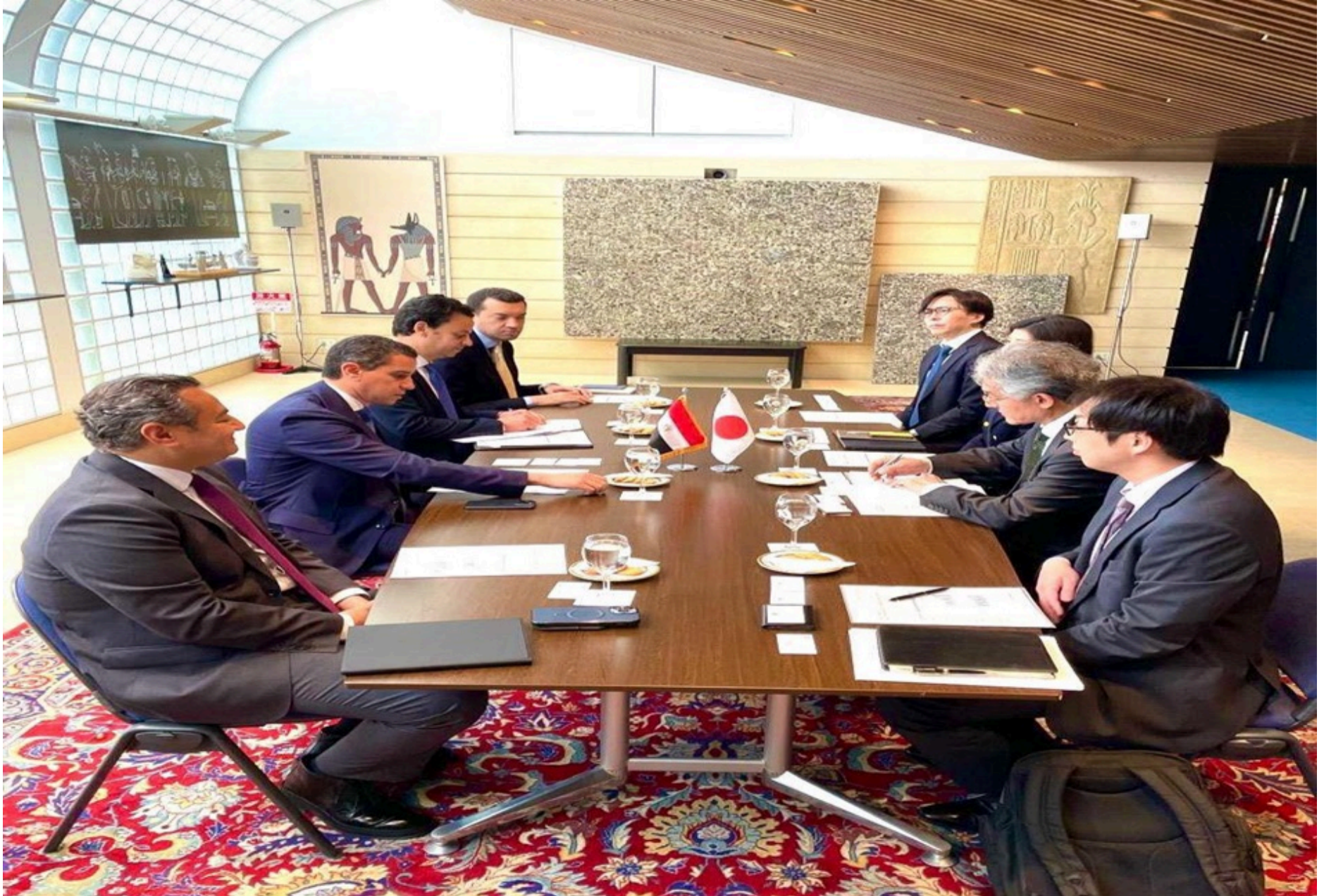
سفير مصر باليابان يبحث مع شركة ميتسوبيشي للصناعات الثقيلة فرص التعاون في مجالات الطاقة الجديدة والمت