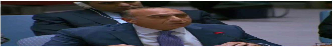
مندوب مصر بالأمم المتحدة: لا توجد حلول عسكرية لأزمة إيران