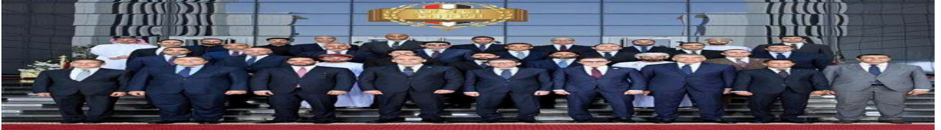
اختتام فعاليات الدورة المتقدمة لتأهيل كوادر هيئات مكافحة الفساد بالدول العربية | صور