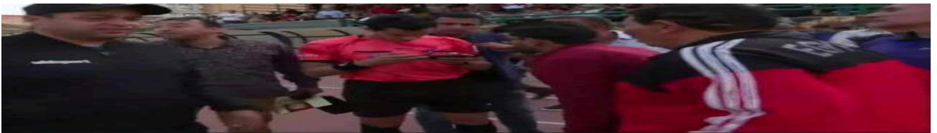
باستخدام موبايل.. تقنية الفار تنهي أزمة في دوري المحترفين