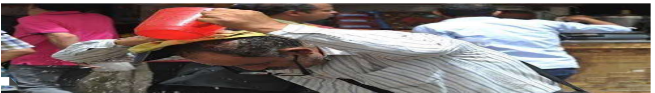
الأرصاد تحذر: أجواء شديدة الحرارة وأتربة مثارة غربا.. وفرص لأمطار رعدية على سيناء