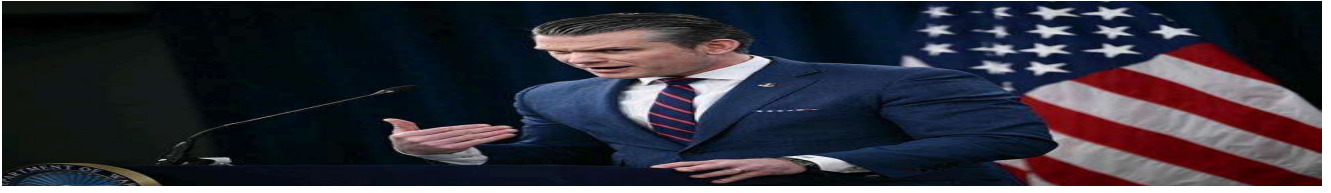
وزير الحرب الأمريكي: الحرس الثوري الإيراني لن يتمكن من إعادة بناء قدراته مرة أخرى