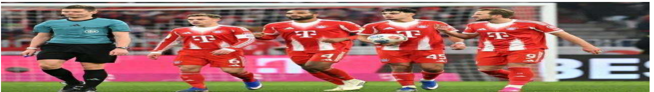
دوري أبطال أوروبا.. جماهير بايرن تعترض بعد إصابة مصورين في موقعة الريال