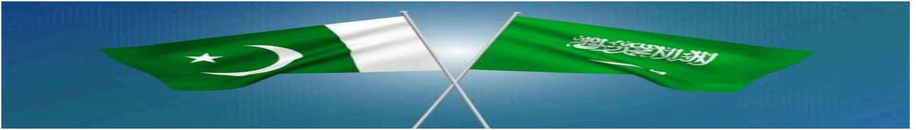
باكستان تتلقى ملياري دولار من السعودية لتلبية متطلبات صندوق النقد الدولي