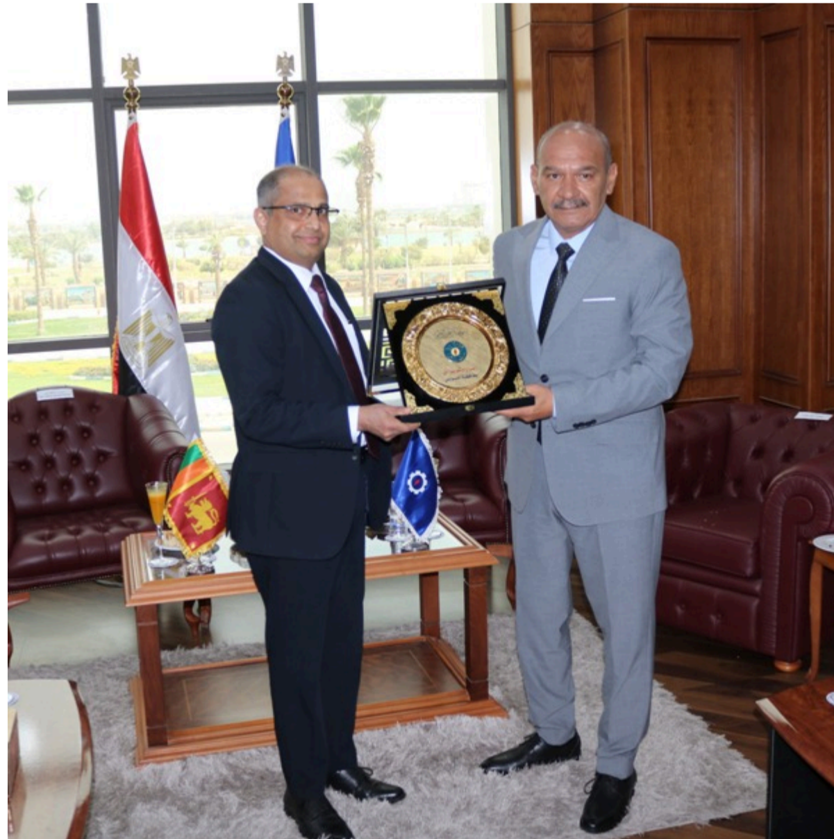
محافظ السويس خلال لقاءه بسفير دولة سريلانكا