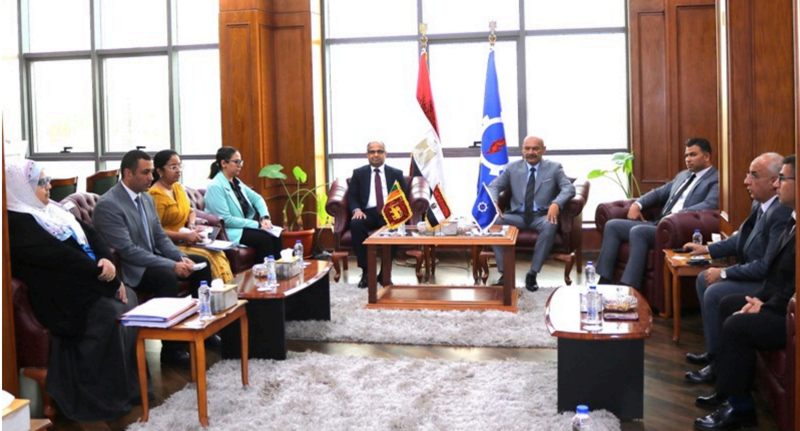
محافظ السويس خلال لقاءه بسفير دولة سيريلانكا