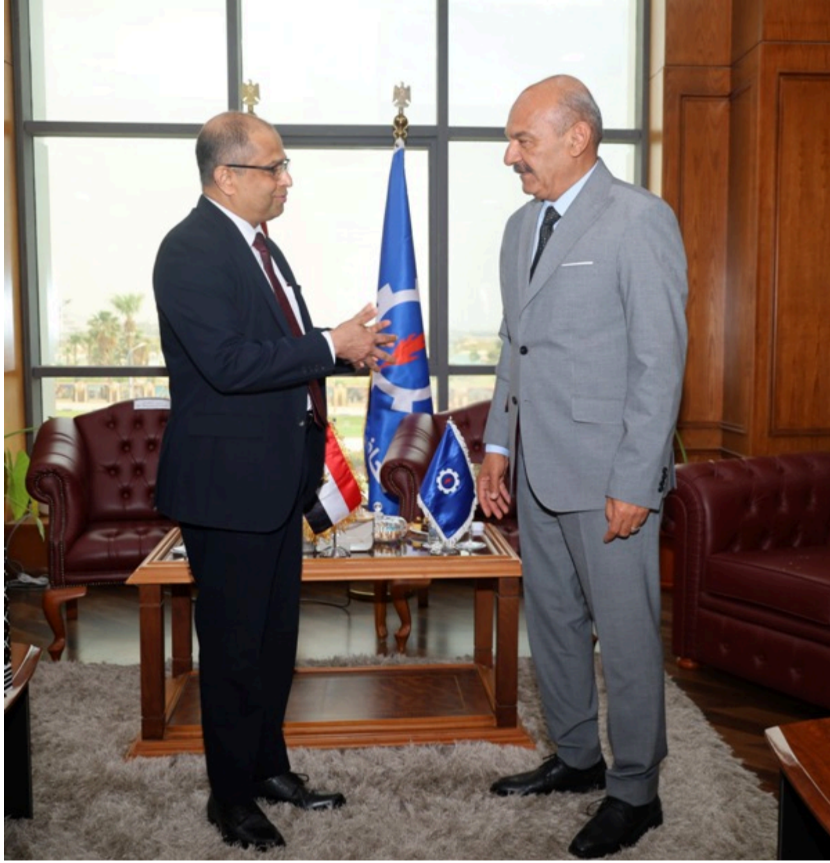
محافظ السويس خلال لقاءه بسفير دولة سيريلانكا