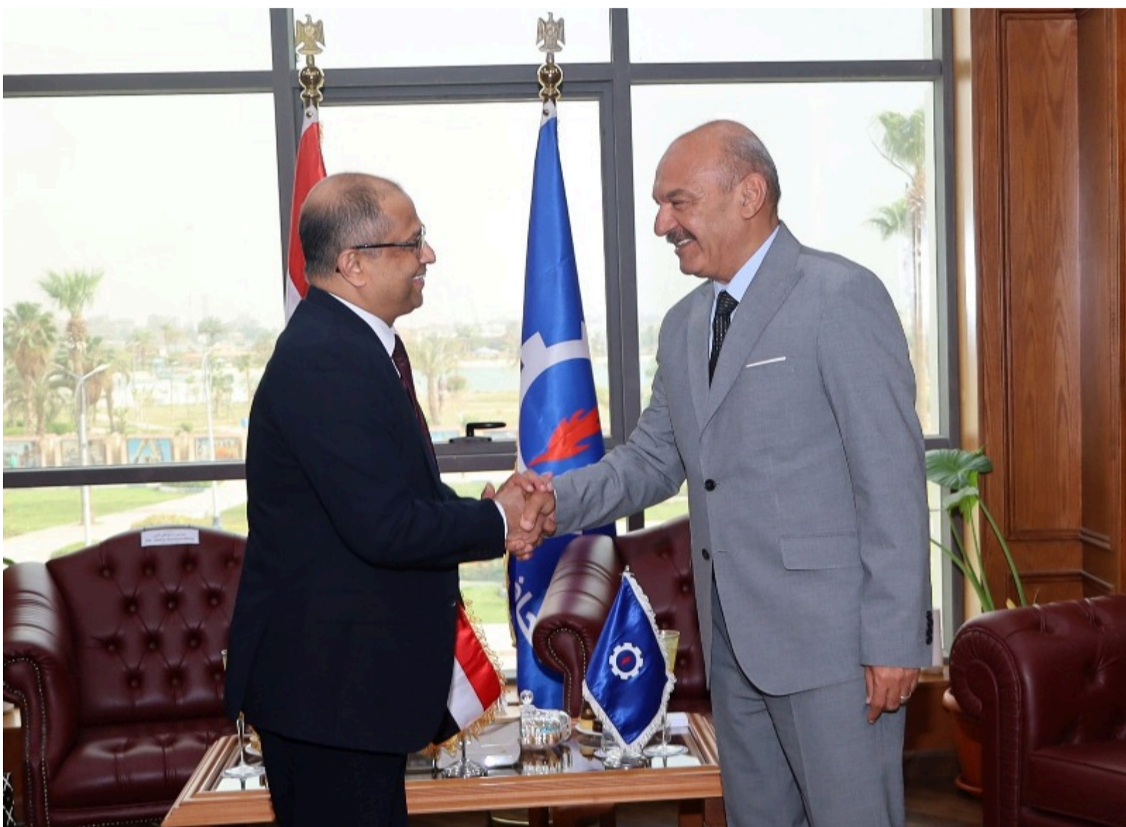
محافظ السويس خلال لقاءه بسفير دولة سيريلانكا

وأكد المحافظ، على عمق العلاقات التاريخية التي تربط بين مصر وسيريلانكا من عدة قرون، واستعرض المقومات الاقتصادية والاستثمارية التي تتمتع بها المحافظة، خاصة المنطقة الاقتصادية لقناة السويس، والموانئ، والمناطق الصناعية، وفرص الاستثمار الواعدة في مجالات متنوعة.